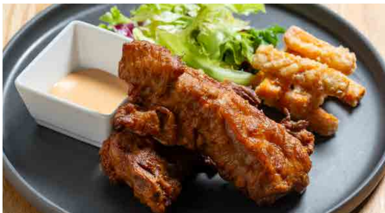
香酥豬肋排搭地瓜薯條 豚スペアリブのグリルと芋けんぴ Crispy Fried Pork Ribs Served with Sweet Potato Fries