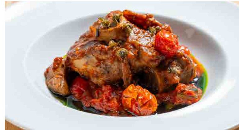
義式燉牛膝 ビーフ ぜんしつ シチュー Ossobuco

僅提供未食用完之主菜外帶 Only unfinished main course is allowed to use take away service.