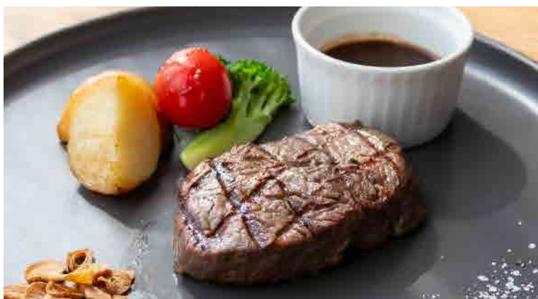
碳烤澳洲牛菲力季節時蔬・牛肉醬汁 オーストラリア産ヒレと 焼き野菜 ビーフグレイビー Grilled Tenderloin Steak with Gravy