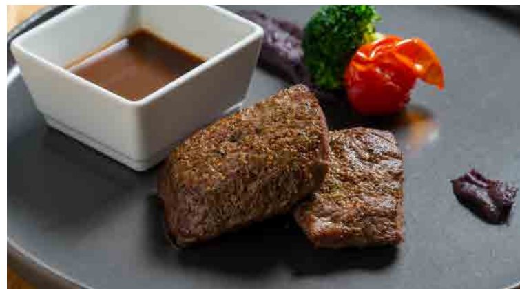
香煎孜然風味羊里肌 クミン風のフライパンラムロース焼き Pan-Seared Cumin-Flavored Lamb Loin

僅提供未食用完之主菜外帶 Only unfinished main course is allowed to use take away service.