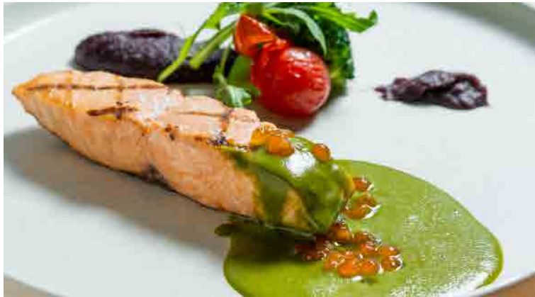
碳烤鮭魚・巴西里奶油醬 焼きサーモン バジリクリーム ソース Grilled Salmon with Parsley Creamy Sauce

平日晚餐・平日ダイナー Weekday Dinner ..... NT$ 880 +10% 假日午晚餐・休日・土日 Weekend Lunch & Dinner ..... NT$ 880 +10%